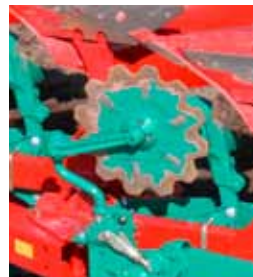
Mais- oder Dungeinleger. Scheibenseche Ø18"/20"