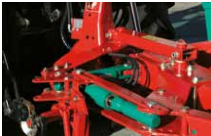
Optional: Hydraulische Vorderfurcheneinstellung und Rahmenschwanzzylinder